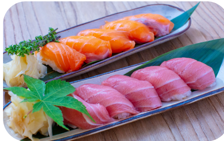
刺身盛り合わせ Assorted sashimi ¥1,650~