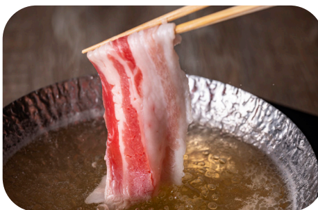
しゃぶしゃぶコース Shabu-shabu course ¥8,000