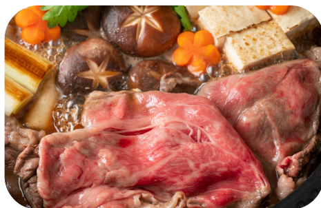
すき焼きコース Sukiyaki course ¥8,000

ボリュームタップリのコース料理をお手軽にお召上がりください。牛肉はワインビーフ(山梨県産)を使用しています。 Enjoy our hearty course meals with ease. We use wine beef (produced in Yamanashi Prefecture).